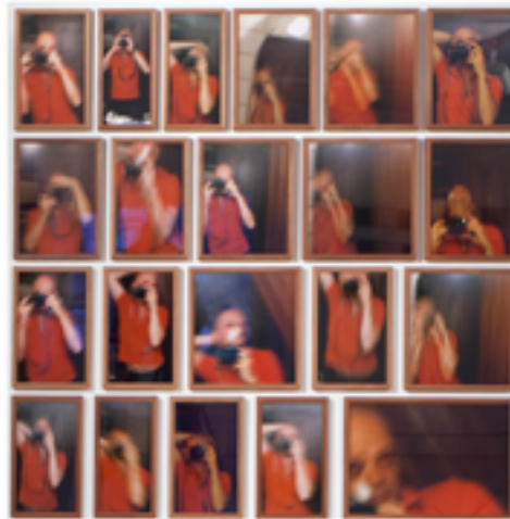
Bild: After, 23 Lambda Prints, olika storlekar, 2002/10

Människor som konfronterats med sin egen dödlighet, försöker senare ofta förtränga detta med en önskan om att oberörda kunna återvända till sitt "gamla jag". Behovet av att återupprätta det "gamla jaget" är också en kärnpunkt i traumaprocessen. Verket After representerar därför något mycket centralt i den traumabearbetande processen.